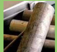
「KUMADAI マグネシウム合金」