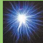
「衝撃エネルギー工学 グローバル先端拠点」