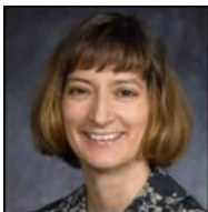
ミレヤ・ソーリス ブルッキングス研究所 北東アジア政策研究センター シニアフェロー/日本研究チエア、アメリカン大学准教授

近年の研究対象は、日本及び中華圏の政治経済で、特に中央と地方の財政関係と財政政策に焦点を当てる。学習院大学と経済産業研究所でリサーチ・スカラーを務める。2009年から2010年までハーバード大学の日米関係に関するウェザーヘッドセンター国際関係プログラムで上級研究員を務める。スタンフォード大学にて経済学と国際関係の学士号取得、同大学で政治学の博士号取得。