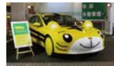
しまじろうカー (ベネッセ)