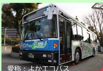
愛称：よかエコバス

運行路線：九州産交バスの熊本市と益城町を走る路線(1日117km) (H30年2月～H31年3月)