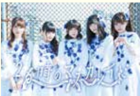
26時のマスカレード

ステージでは、エコを呼びかけるアイドルやキャラクターショー、アーティストによるLIVE、著名人によるトークショーなどが行われます。詳しくはホームページで発表します。