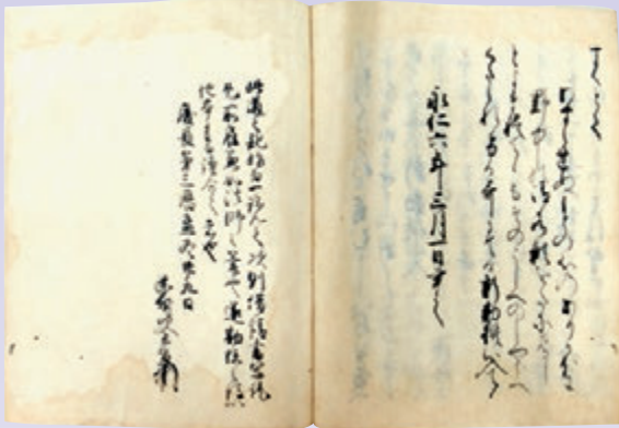
「いざよひの日記」(永青文庫)

去る2017年は、細川幽齋が九州に足を踏み入れてから430年目に当たりました。天正15(1587)年3月、豊後国大友氏と薩摩国島津氏との紛争を調停するため、豊臣秀吉は自ら九州に下向しました。当時、丹後国田辺城(京都府舞鶴市)に隠棲していた幽齋も、翌月に出発します。幽齋は、最南は大宰府まで下り、そして同年7月に帰坂しました。この3ヶ月の道中記が『九州道の記』であり、永青文庫には幽齋自筆本が残ります。本資料展は、幽齋が関係した書籍を中心に、古典文学における「旅」のイメージを紹介します。なお、紀行文の代表とされる芭蕉『奥の細道』は永青文庫に収められません。このように、収蔵される資料の種類にも、永青文庫の特徴が垣間見えます。