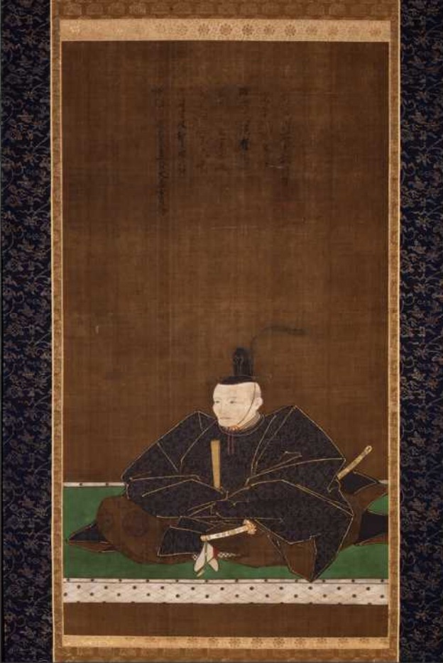
葡萄酒製造を命じた細川忠利