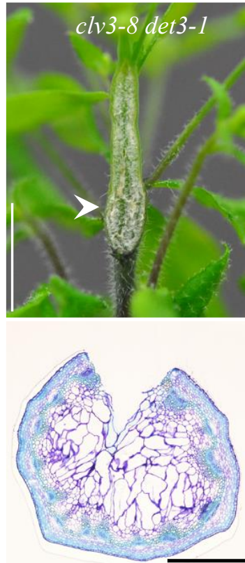
図1 (上) clv3 det3 二重変異体の茎に生じた亀裂。播種後1ヶ月間の植物体の写真。白い矢尻は亀裂を示す。スケール：5 mm。(下) 亀裂が発生した後の clv3 det3 二重変異体の茎の横断切片の顕微鏡画像。スケール：500 \mu m。