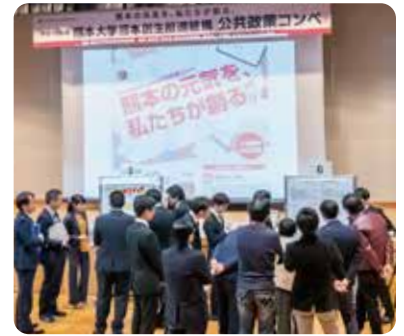
2018年ポスターセッションの様子

今回で11回目となる 熊本大学熊本創生推進機構 公共政策コンペは「新しい『ふるさと』のかたち」と題し、地域づくりや現代社会が直面している課題に関心のある多くの方から熊本をより元気にするような政策提言を募集します。