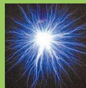
「衝撃エネルギー工学 グローバル先端拠点」