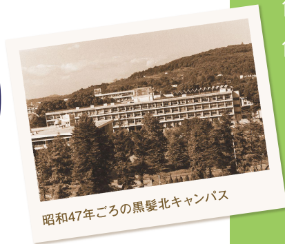
昭和47年ごろの黒髪北キャンパス

ホームカミングデーとは、 母校を訪れて懐かしい学友や恩 師と再会を果たし、互いに親睦を深 めていただこうと、大学が卒業生の皆 さまをお招きするひとときです。 ご来学を機会にクラス会の開催を 企画するなど、もっと交流の輪を 広げてみませんか？