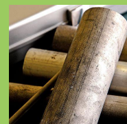
「KUMADAI マグネシウム合金」